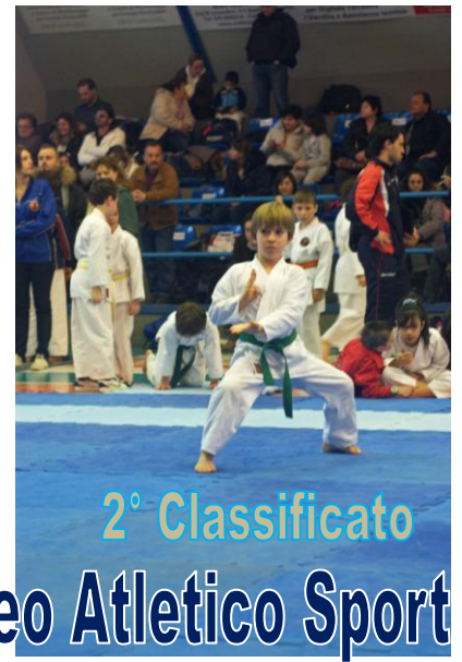
2° Classificato Torneo Atletico Sport Bastia 11 marzo 2012